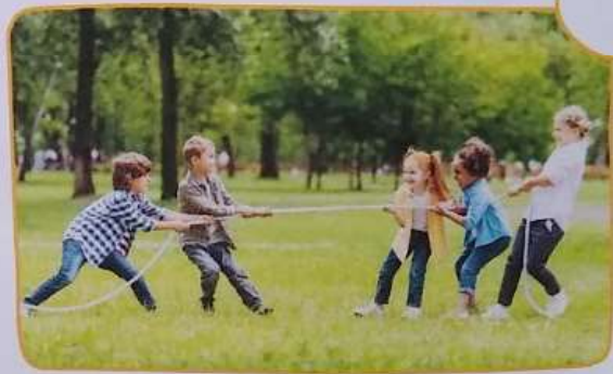
CABO DE GUERRA